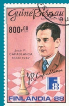
● Guinea Bissau