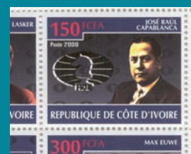
● Costa de Marfil