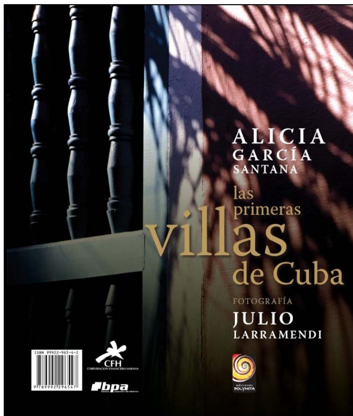
Portada del libro Las primeras villas de Cuba (Ediciones Polymita, 2008), con texto de la Dra. Alicia García Santana y fotografías de Julio Larramendi