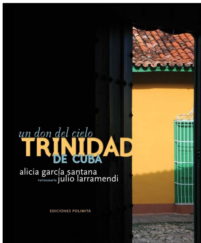
Portada del libro Trinidad de Cuba: un don del cielo (Ediciones Polymita, 2010), con texto de la Dra. Alicia García Santana y fotografías de Julio Larramendi