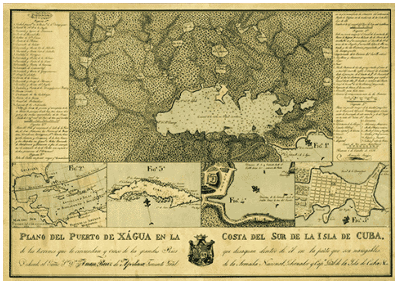
Parte del plano de Alejandro Bouyón, 1813.