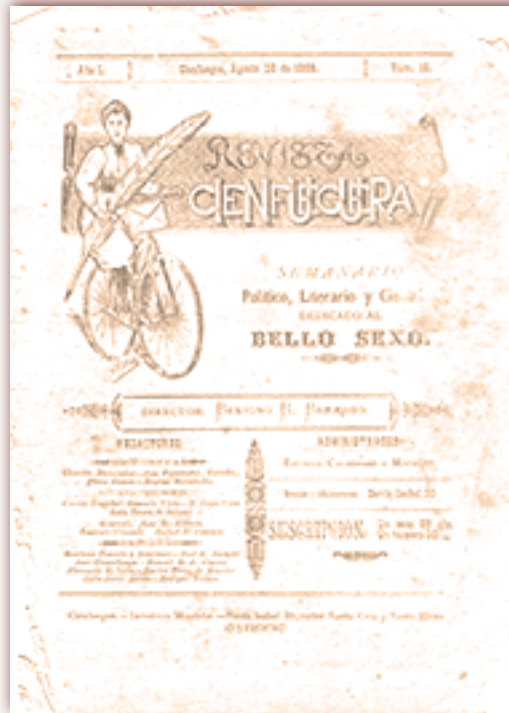
Arriba: Portada de Revista cienfueguera , semanario político, literario y científico de la ciudad de Cienfuegos.

De 2005 a la fecha, al tradicional contenido de las investigaciones históricas acerca de la presencia francesa en Cienfuegos, abordada desde los ascendentes de familias con ilustres apellidos o sus expresiones en el identitario popular, se suma una nueva arista: el desarrollo socioeconómico de la localidad sureña, a partir de la incidencia de fórmulas cooperativas de trabajo, basadas en los principios universales de libertad, igualdad y fraternidad enarbolados por Cuba Cooperación-Francia.