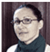
Yusi Padrón Alonso Redacción