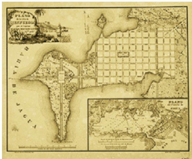
Parte del plano de Alejo Helvecio Lanier, 1839.

constituir el primer y excepcional ejemplo de un conjunto arquitectónico representativo de las nuevas ideas de modernidad, higiene y orden, en el planeamiento urbano desarrollado en la América Latina del siglo XIX”, es el más elevado reconocimiento que puede recibir esta ciudad, la cual honra con su existencia al pensamiento ilustrado cubano.