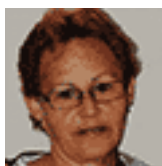
Roxana Aedo Cuesta Redacción y corrección

Si desea suscribirse a este boletín, envíe un e-mail a: