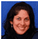
Idania Dorta Rodríguez Diseño y realización