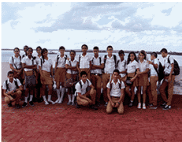
Durante la visita a la Emisora Radio Ciudad del Mar.

Así han conocido los secretos que se esconden tras el telón del teatro Tomás Terry, baluarte de las artes escénicas en la provincia; las leyendas vinculadas a la tradición oral precolombina en una visita al Palacio de Valle y la escultura de la India Guanaroca de la artista Rita Longa. El destino de mayor aceptación fue la imprenta La Correspondencia. Los desafíos que enfrentan diariamente