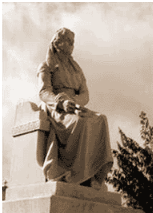
Monumento de mármol dedicado a Anita Fernández situado en el anfiteatro de la escuela Octavio García de Cienfuegos.

menaje de recordación a la insigne benefactora de la ciudad. Existe aún el inmueble dedicado a la labor educativa y de instrucción a futuros maestros. Es una digna manera de recordar la dedicación y el amor al magisterio de Anita Fernández Velasco.