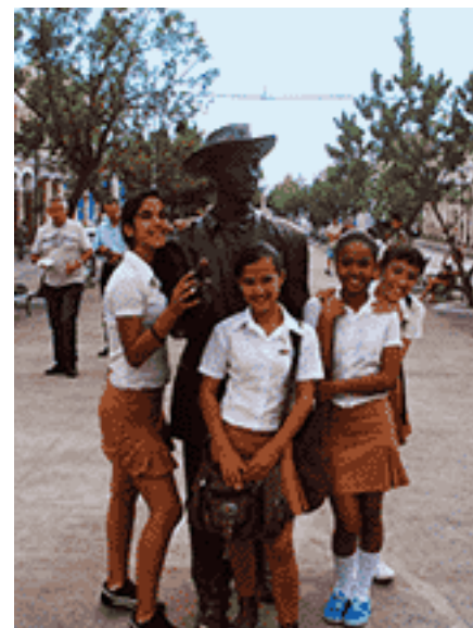
Junto a la escultura del artista José Villa Soberón dedicada a Benny Moré, durante un recorrido por la ciudad.

Este primer aniversario se celebró con una propuesta especial, que fue el lanzamiento del concurso El conocimiento está en tus pasos, mediante el cual los estudiantes reflejaron en una composición las experiencias y conocimientos adquiridos en el proyecto. Se realizó además el esperado recorrido por la emisora radial Radio Ciudad del Mar donde visitaron los diferentes departamentos que componen la institución así como