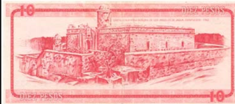
Billote de 10 pesos con la imagen del castillo de Nuestra Señora de los Angeles de Jagua. Certificado de Divisa A, para los extranjeros residentes temporalmente en Cuba. Emitido el 1 de octubre de 1965.

En las reiteradas ocasiones que he visitado la Perla del Sur , he hallado una magia exclusiva en sus edificaciones distintivas, el Teatro Tomás Terry, el embrujador Palacio de Valle, el señorial Parque Martí con la Catedral de la Purísima Concepción y el Palacio de Gobierno, la Casa del Fundador, el Cementerio Tomás Acea, el famoso entorno de la Punta con sus palacios eclécticos de comienzos del siglo XX y la espléndida fortaleza de Nuestra Señora de los Angeles de Jagua.