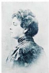
Fotografía que acompañó un artículo del periódico "La Aurora" Cárdenas. 1911.