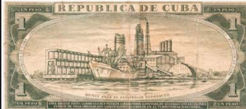
Billote de 1 peso, año 1975 en el XV Aniversario de la Nacionalización de la Banca, este es el primer billete conmemorativo emitido por la Revolución. En el reverso el Terminal de Embarque de azúcar a gran y Planta de Fertilizantes Nitrogenados de Cienfuegos.

Su bahía de bolsa tiene un sello peculiar. A través de su vida porticada ha recibido lo más importante de las influencias y desarrollo de los distintos momentos históricos económicos y culturales que ha vivido.