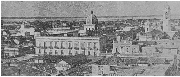
Fotografía publicada en "Cárdenas Social", Julio de 1936, en un artículo dedicado a los remeros cardenenses en las Regatas de Cienfuegos.

En 200 años el relieve cambia, los ríos se oscurecen, las nieves se funden y los hombres se renuevan, y eso es lo que hoy nos ofrece Cienfuegos, una ciudad renovada por sus dirigentes y amorosos hijos, una urbe concebida y fomentada con sobradas aspiraciones de capital y que actualmente se muestra en todo su esplendor con verdadero orgullo.